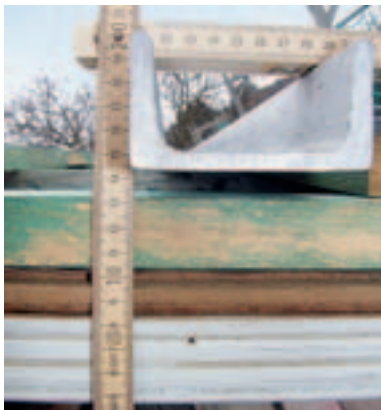
Dachüberstand aus Furnierschichtholz (weiß), der etwa 13 mm nach unten hängt