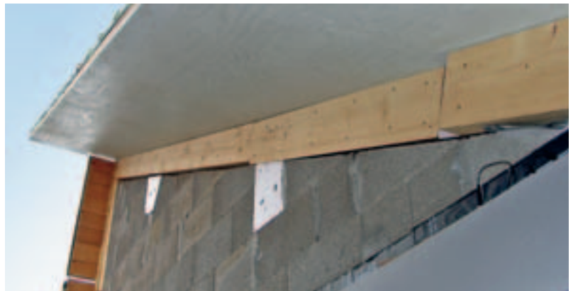
Der Dachüberstand aus Furnierschichtholz im Detail: Das Stahlprofil dient als Messhilfe

Den negativen Einfluss der Feuchtigkeit auf die Festigkeitswerte von Holz berücksichtigt die gültige Bemessungsnorm DIN 1052 (1988) durch Abminderungsfaktoren. Differenzierter zeigt sich in diesem Punkt die neue DIN 1052 (2004). Die Norm berücksichtigt den Feuchteinfluss auf die Tragfähigkeit des Holzes über eine Einteilung in drei Nutzungsklassen.