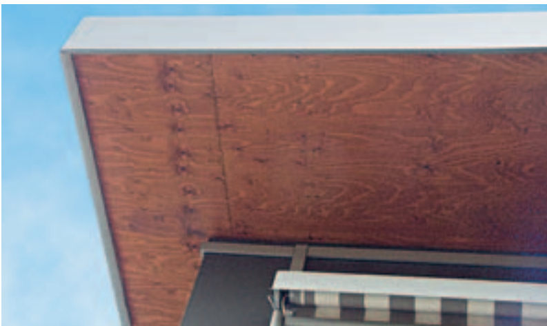
Untersicht eines freitragenden Dachüberstandes, hergestellt aus einer Furnierschichtholzplatte

OSB- oder Furnierschichtholzplatten nutzen Zimmerer gerne als Dachschalung und freitragende Dachüberstände. Um Schäden zu vermeiden, müssen die unterschiedlichen Anforderungen aus den Bemessungs- und Holzschutznormen eingehalten werden.