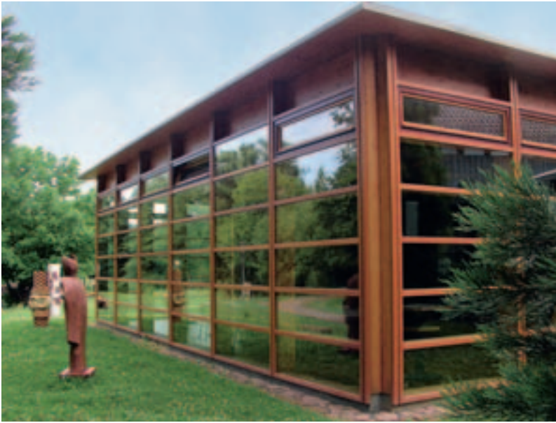
Beim Holzkompetenzzentrum in Nettersheim wurde der Dachüberstand aus Holzwerkstoffen richtig geplant

Hersteller eine Behandlung mit einem Holzschutzmittel nicht durchführen, sind diese Produkte aus Sicht des Holzschutzes für den geschilderten Einsatzbereich eigentlich nicht zugelassen.